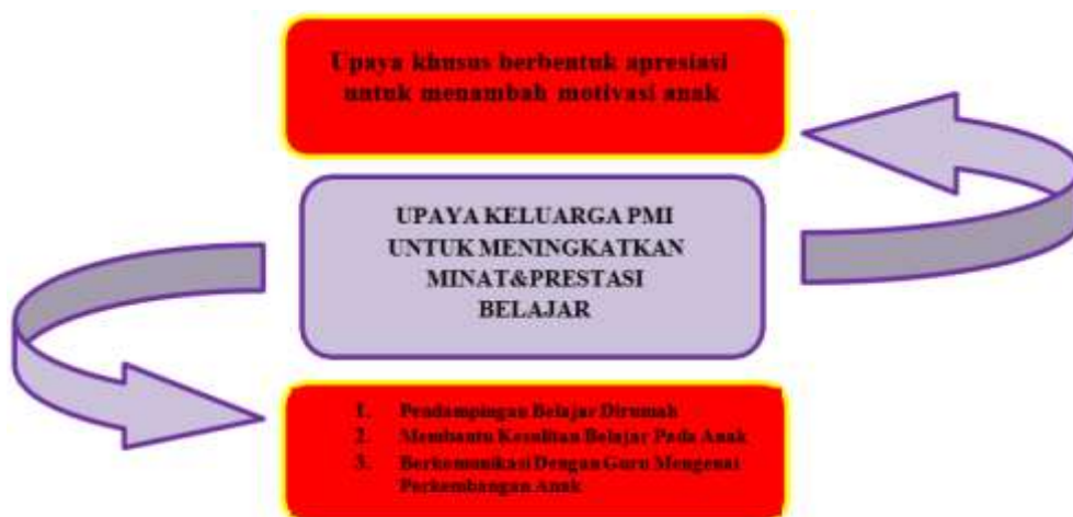
Gambar 4.4 Upaya Keluarga PMI untuk Meningkatkan Minat dan Prestasi Belajar