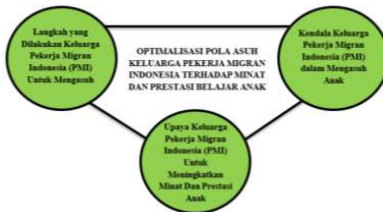
Gambar 4.1 Fokus Penelitian

Hal yang memiliki keterkaitan dengan Optimalisasi Pola Asuh Keluarga Pekerja Migran Terhadap Minat Dan Prestasi Anak, peneliti bertekad untuk mendapatkan data dengan secara langsung dan sumber data yang ada di Desa Tanggulturus, Kecamatan Besuki, Kabupaten Tulungagung dengan sumber data sebagai mana yang telah dijelaskan pada tahap sebelumnya. melalui wawancara mendalam, observasi partisipan dan study dokumenter yang dilakukan. Peneliti mendapatkan hasil sebagaimana berikut yang juga telah dikelompokkan dalam tiap fokus penelitian dalam penelitian ini: