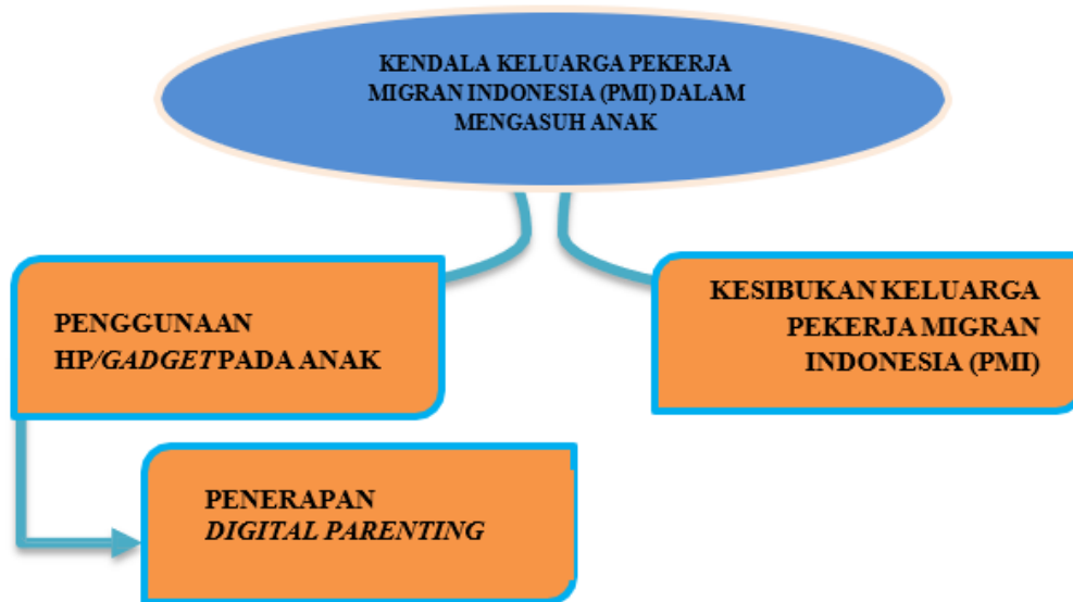
Gambar 4.3 Kendala Keluarga Pekerja Migran Indonesia (PMI) dalam Mengasuh Anak

Melalui hasil penelitian dalam fokus penelitian ini dapat dilihat penggunaan HP/gadget seperti pisau bermata dua, dimana disisi lain memberikan kendala dalam memberikan pengasuhan apabila tidak dibatasi penggunaannya pada anak, disisi lain juga memiliki kebaikan dalam proses pengasuhan yang dilakukan oleh orang tua seperti halnya meringankan proses pengasuhan ataupun pemberian informasi yang berasal dari aktivitas media sosial dari anak, maka dari hal tersebut sangat perlu dilakukan pendampingan terhadap anak oleh keluarga dalam penggunaan gadget agar memiliki fungsi yang menunjang, bukan menghambat.