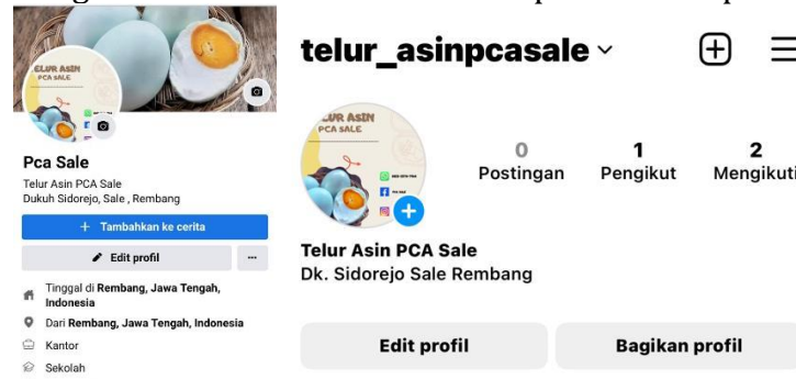
Gambar 5. Media Pemasaran Online