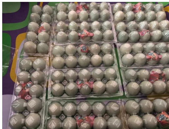
Gambar 7. Pengemasan Telur Asin