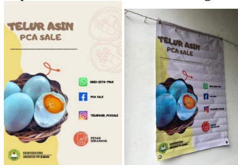
Gambar 1 & 2. Desain Banner UMKM dan Banner yang Sudah Terpasang di UMKM