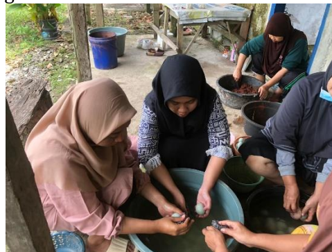
Gambar 6. Proses pendampingan Pembuatan Telur Asin