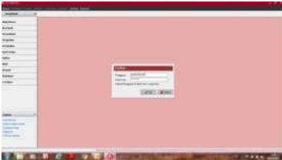
Gambar 3. Login