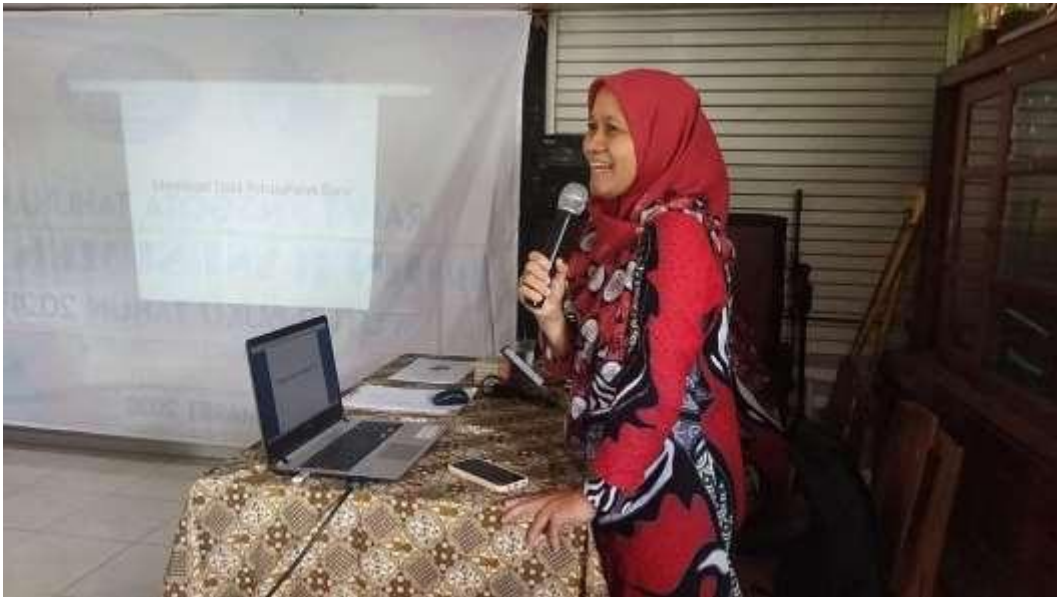
Gambar 7. Narasumber 1