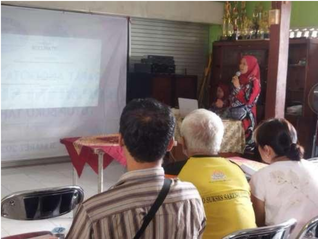
Gambar 9. pelaksanaan pelatihan