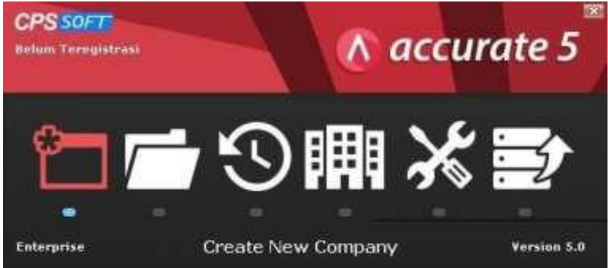
Gambar 1. ACCURATE

Membuat Database baru di Komputer Lokal :