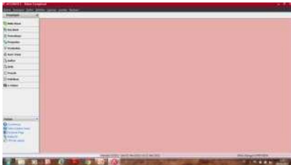
Gambar 4. Tampilan menu pada Accurat