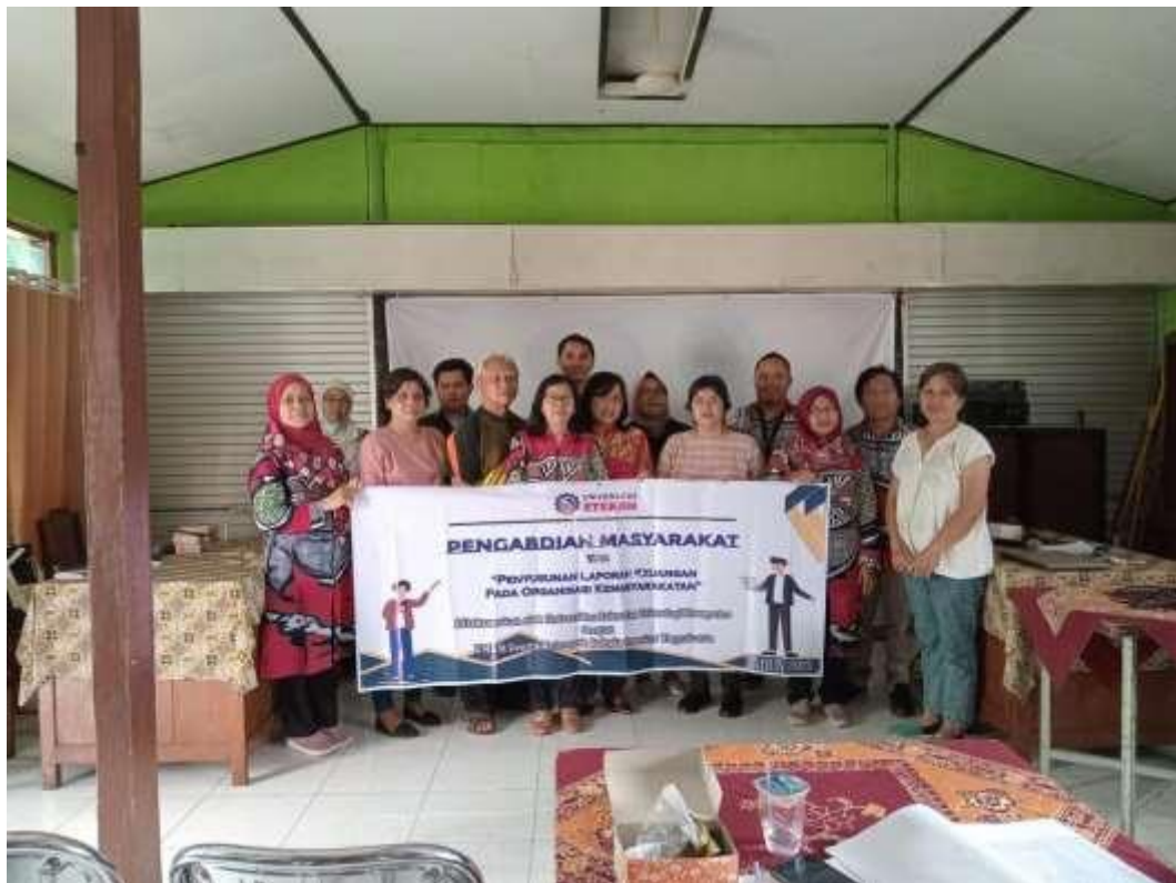
Gambar 6. sesi foto bersama