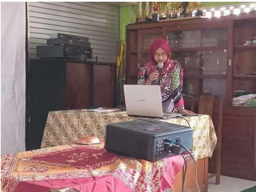
Gambar 8. sambutan Kaprodi